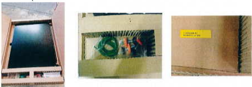
1- Image de la composition. De gauche à droite : la table, les accessoires, le lot de feuilles.

L'emballage de la table a été conçu spécifiquement par nos équipes afin de protéger au mieux votre nouvelle table à mobiles autoportés.