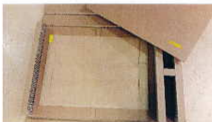
3- Images du lot de 50 feuilles fourni.

La table doit être posée à plat pour la suite du montage et du réglage.