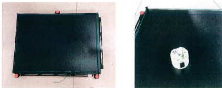
7- Mobile placé sur la table.