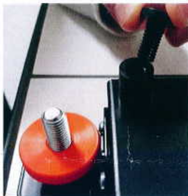
5- Visser la partie supérieure des 4 supports de ring.

Pour le placement du ring, visser la partie supérieure des 4 supports de ring.