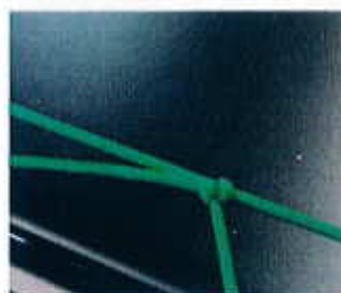
6- Placement du ring et serrage.