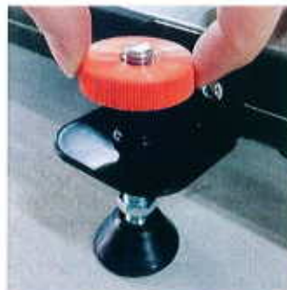
4- Montage des pieds sur les cornières

Pour le placement du ring, visser la partie supérieure des 4 supports de ring.